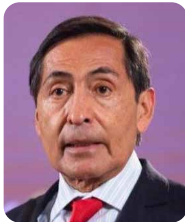
Rogelio Ramírez de la O.