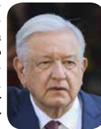
Andrés Manuel López

Pero una de las promesas de campaña de López Obrador, que sí cumplió al llegar al poder, fue romper el acuerdo que hubo sexenios atrás, así que desde 2018 ni Carlos Salinas de Gortari, ni Ernesto Zedillo Ponce de León, Vicente Fox Quesada, ni Felipe Calderón Hinojosa, han recibido un cinco ni los privilegios que significaba esa pensión gravosa para el erario mexicano.