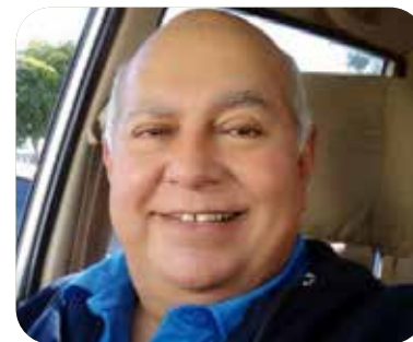
Marcelino Pérez Arenas

La elección del domingo 2 de junio arrojó grandes perdedores en términos de que algunos de los personajes derrotados llegaron a tener en el pasado un gran poderío político en Sonora. Ese fue el caso del exgobernador Manlio Fabio Beltrones quien perdió en su intento por ser senador; pero al quedar en segundo lugar, se coló al Senado como segundo perdedor.