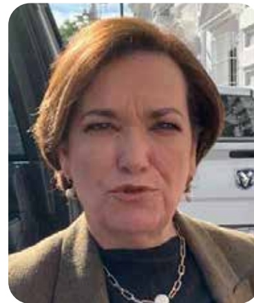
Dolores del Río